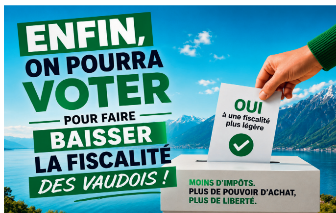
Le moment est venu de voter pour une fiscalité plus juste. Image générée par IA

Après plus de trois ans d'attente, les Vaudoises et les Vaudois pourront enfin se prononcer sur l'initiative populaire cantonale «Baisse d'impôts pour tous». Cette initiative propose une réduction de 12% des impôts cantonaux sur le revenu et la fortune. Son objectif est simple: redonner du pouvoir d'achat aux classes moyennes. Selon les dernières statistiques disponibles, la fiscalité vaudoise des personnes physiques est la plus lourde de toute la Suisse. Une telle situation n'est plus acceptable.