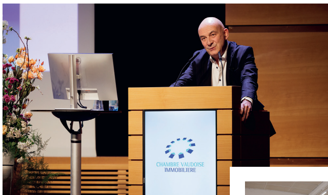
Le journaliste économique François Lenglet.