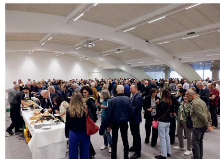
Les échanges se sont poursuivis lors du cocktail dînatoire.

Approbation des comptes 2025 et décharge au comité pour sa gestion