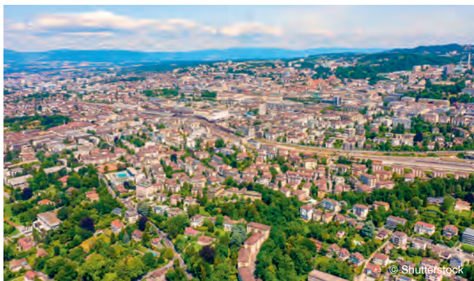
La réforme de la LATC vise à simplifier les procédures et à mieux encadrer le développement du territoire.

Le Conseil d'Etat a mis en consultation, le 26 mars dernier, un avant-projet de révision de la loi sur l'aménagement du territoire et les constructions (LATC). Cette consultation publique, qui court jusqu'au 30 juin, vise à adapter le cadre légal aux défis actuels en renforçant l'efficacité des procédures.