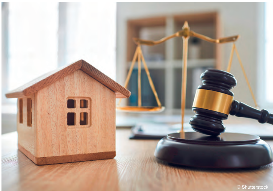
La justice a tranché la question de la réduction des loyers commerciaux en cas de pandémie.

Aux côtés de toute une série de partenaires publics et privés, la CVI a contribué à l'organisation et à la promotion d'une conférence relative aux enjeux autour du patrimoine arboré qui a eu lieu le 1 er octobre 2025 à Crissier en présence de près de 400 personnes.